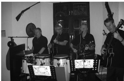
Unsere Liveband „Kölsche Ramazottis“