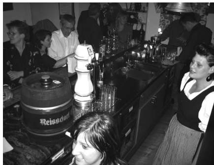
An der Turnbar