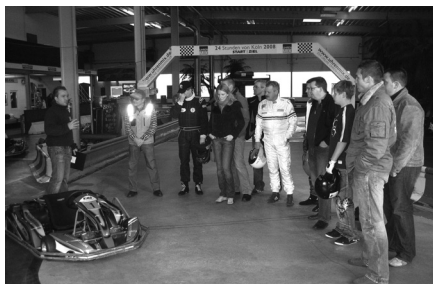
Fahrerbesprechung zum Jubiläums-kartrennen

Etwas ganz besonderes hatte sich die Abteilungsleitung für die Mitglieder ausgedacht. In der Einladung es wirklich wie ein gelungenes Programm aus. Nach Abschluss des Programms am 29.11.2008 und 30.11.2008 kann man nur eines sagen: Es war mehr als gelungen. Es war einfach Klasse!