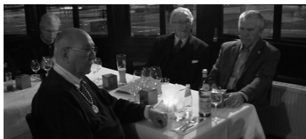
konzentriert wird zugehört.

Der Beginn erfolgte zu Gunsten mehrerer SK mit längerem Reiseweg tatsächlich um 18.35 Uhr.